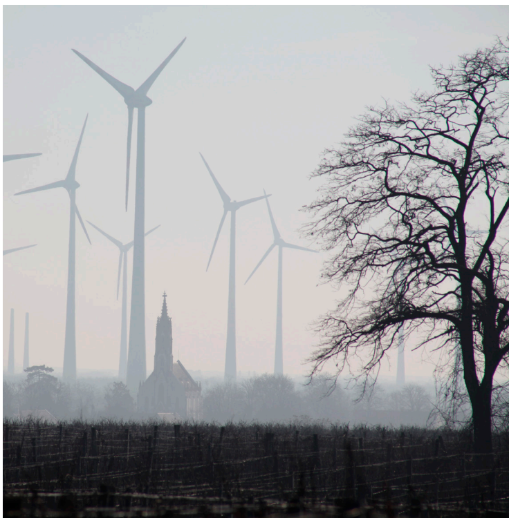
Die Naturschutzorganisation „Alliance for Nature“ fordert eine Natur- und Umweltverträglichkeitsprüfung.

„Alliance for Nature“ hat deshalb gegen den Bescheid der NÖ Landesregierung fristgerecht Beschwerde eingebracht. Der Feststellungsbescheid sei wegen Rechtswidrigkeit aufzuheben und eine Natur- und Umweltverträglichkeitsprüfung durchzuführen. Ob die Naturschützer recht bekommen, muss der Bundesverwaltungsgerichtshof entscheiden.