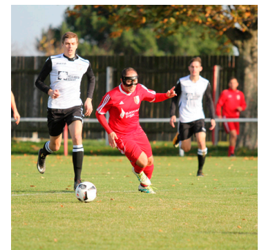
SF Berg ist mittlerweile knapp 100 Jahre alt.

damals noch auf der Kuhweide entlang der Wolfsthalerstraße ausgetragen. Und auch den Meisterschaftsbetrieb gab es in den 20ern noch nicht. Die Glanzzeit begann mit 1982, als die Sportfreunde erstmals in die Unterliga Süd/Südost aufstiegen und sich dort bis 2005 hielten. 23 Jahre lang waren die Berger ununterbrochen in der in Gebietsliga umgetaufte Meisterschaftsklasse zu finden, danach mussten die Sportfreunde den Weg in die 1. Klasse Ost antreten. Aber: Der Abstieg in die 2. Klasse wurde